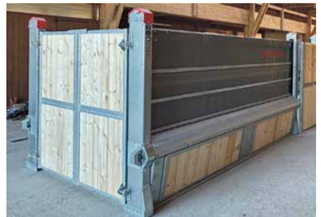
Ukosená spodní stěna umožňuje koním náklon při krmení.