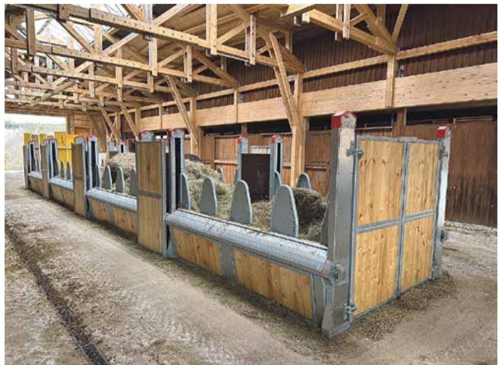
Do krmiště lze zakládat balíkové i volně ložené seno.