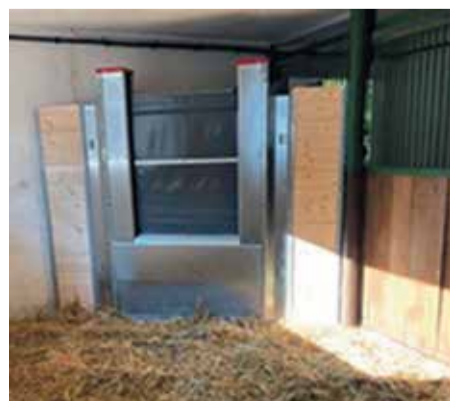
Posuvnou stěnu lze instalovat i do boxu pro jednoho koně.